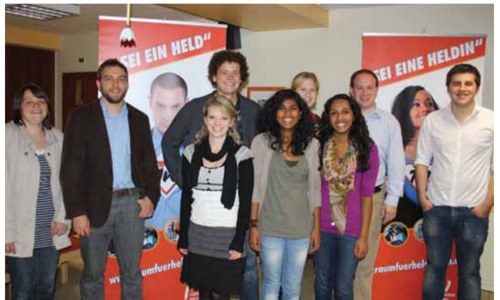
Der erste Vorstand ist gewählt: AWO Jugendwerk in der Städteregion Aachen