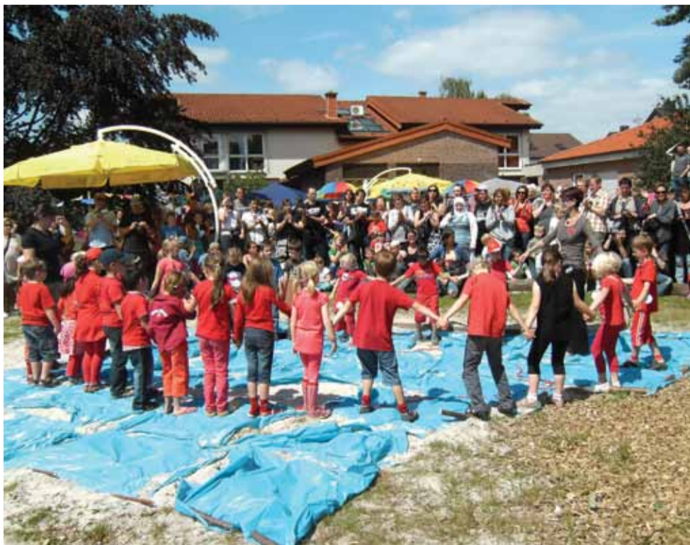
Das Sommerfest des AWO Familienzentrums „Helene Simon“ zog bei schönstem Wetter viele Besucher an

Alle Erlöse des Festes gingen zu Gunsten des Fördervereins der AWO Kita „Helene Simon“ und werden für die weitere Umgestaltung des naturnahen Außengeländes in Form einer Wasserspiel-Landschaft investiert.